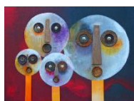
Photo de couverture, avec l'aimable autorisation de l'artiste, Marie Henriot http://mariehenriot.blog.free.fr/